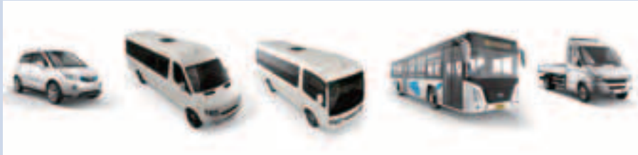
集團生產的純電動車產品型號

如集團於11月2日刊登之公告所述，集團考慮到A \ \ \ \ \的未來發展，決定盡早收購A \ \ \ \ \ 餘下之41.5%股本。集團管理層認為A \ \ \ \ \交易就監督目前杭州電動車生產廠房的建設而言，將可更有效地管理A \ \ \ \ \的日常業務，滿足A \ \ \ \ \的融資要求及實施未來計劃，並將進一步鞏固電動車業務的垂直整合及令五龍緊密控制總生產成本及在其競爭者當中獲得競爭優勢。