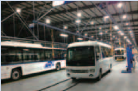
2014年11月，首批電動車於昆明工廠正式投產

集團自主研發的中巴系列、商務車系列及公共巴士系列產品已獲工信部的新產品公告，目前已經具備正式上市銷售條件。其中，首批生產的純電動公共巴士(12米)系列為全承載安全車身，首發車型為12米低地板和低入口，同時採用輪邊雙電機驅動橋，續駛里程高達260公里；中巴和商務車為全承載衝壓焊接安全車身，採用集團根據整車特點度身定制高性能改性而生產的動力電池，電驅動系統為自主研發的輪邊雙電機驅動橋，續駛里程可達260公里。