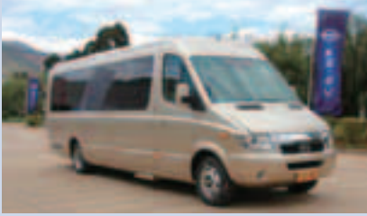
集團生產的純電動商務車 - E 6810 系列

集團自主研發的中巴系列、商務車系列及公共巴士系列產品已獲工信部的新產品公告，目前已經具備正式上市銷售條件。其中，首批生產的純電動公共巴士(12米)系列為全承載安全車身，首發車型為12米低地板和低入口，同時採用輪邊雙電機驅動橋，續駛里程高達260公里；中巴和商務車為全承載衝壓焊接安全車身，採用集團根據整車特點度身定制高性能改性而生產的動力電池，電驅動系統為自主研發的輪邊雙電機驅動橋，續駛里程可達260公里。