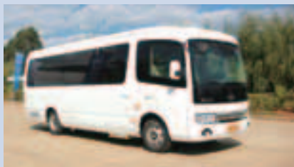
集團生產的純電動中巴 - E 6750系列