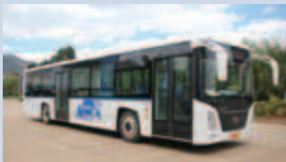
集團生產的純電動公共巴士 - E 6120系列

昆明廠房擁有年產10,000輛大巴、公共巴士和中巴、商務車的生產能力，首批下線的純電動汽車包括兩款E 6120系列12米純電動公共巴士以及兩款E 6750系列純電動高端中巴和兩款E 6810系列純電動高端商務車。該三種系列產品均是完全根據純電動車的特點全新正向開發，產品技術定位為國際先進水準，致力打造成雲南省內規模完善及技術領先的電動車產業化生產基地。